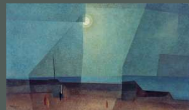
ライオネル・ファイニンガー《海辺の夕暮》 1927年

入場料 一般 510(410)円 大学生 310(250)円 (縮景園共通券) 一般 660円 大学生 350円