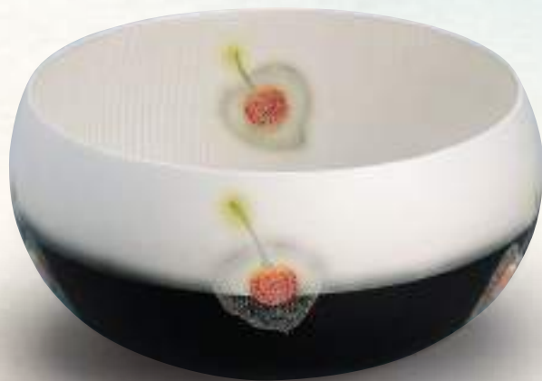
井戸川 豊《銀泥彩磁鬼灯文鉢》日本工芸会保持者賞

The 71st Japan Traditional Kōgei — Art Crafts — Exhibition