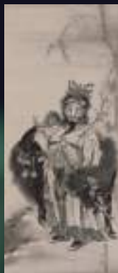
會我蕭白《伯顔図》 1767年頃