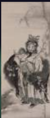
會我蕭白<伯顔図> 1767年頃

入館料 一般：510円 大学生310円 縮景園共通券：一般 610円 大学生350円