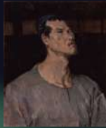
暁光(帽子をかむる自画像)1943年