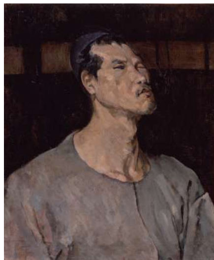
巖光 《帽子をかむる自画像》1943年

※伝統工芸展の会期中は伝統工芸展の入場券でもご覧いただけます。 ※65歳以上の方や障害者手帳をお持ちの方、県内の大学に在学する留学生の方などは 無料でご覧いただけます。【要証明書】 ※20名以上の団体は割引あり ※特別展は別料金