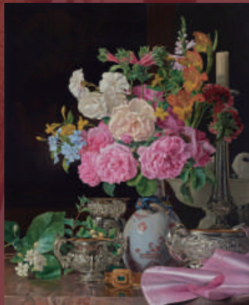
フェルディナント・ゲオルク・ヴァルトミューラー〈磁器の花瓶の花、燭台、銀器〉1839年

リヒテンシュタイン侯爵家のコレクションは、その華麗さから宝石箱にもたとえられます。侯爵たちが愛し収集した北方ルネサンス、バロック、ロココを中心とする油彩画と、東洋・西洋の陶磁器、合わせて126点を展示。宮殿を飾った絵画と陶磁器の共演をお楽しみください。