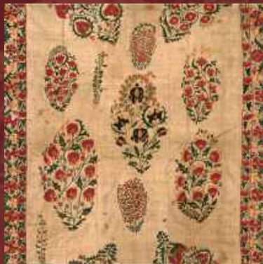
刺繍布(スザニ)(部分)、シャフリサブス、1850年頃、広島県立美術館蔵

豊富なコレクションの中から、広島出身の洋画家・南薫造や中央アジアのスザニなど、当館を代表する名品群を紹介。併せて、縮景園築庭400年を記念した特集も行います。