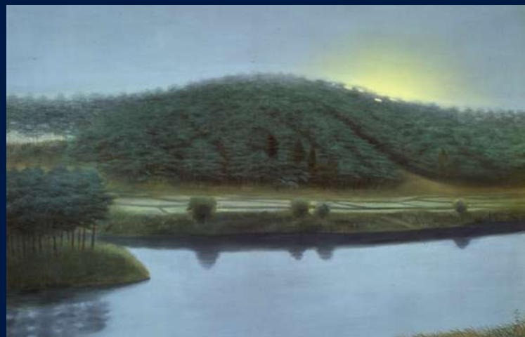
奥田元宗《待月》1949年 広島県立美術館