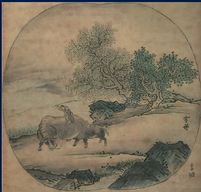
重要文化財 雪舟等楊筆〈倣李唐牧牛圖(牧童)〉 室町時代(15世紀) 山口県立美術館 展示予定9/10~9/29