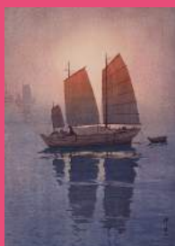
吉田博《瀬川内海船「帆船 帆」》

◎65歳以上の方や障害者手帳をお持ちの方、県内の大学に在学する留学生の方などは無料でご覧いただけます。